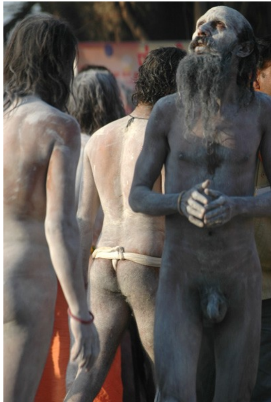
Groupe de sādhus, ayant renoncé à tout pour parvenir à la moksha, jusqu'aux moindres vêtements, et s'enduisant le corps de cendres, symbole de leur mort.

• La bakhti. C'est la voie du mysticisme hindou. L'essentiel n'est plus les rites, mais une relation amoureuse avec la divinité, qui cherche à devenir fusionnelle. Le fidèle s'abandonne à la divinité dans une relation d'amour partagé. Arrivé à un certain stade, le fidèle et la divinité ne vont faire plus qu'un suite à cette fusion amoureuse mystique (23) , ce qui fait que le fidèle a atteint, de son vivant même, une nature semblable à la divinité, même si c'est de façon éphémère. En répétant cet état mystique, il lui sera beaucoup plus facile, à sa mort corporelle, de fusionner directement avec le Brahman, comme c'est le cas pour une divinité qui, elle, est très proche du Brahman. Cette voie du mysticisme hindou a été prêchée, entre autres, par Ramakrishna.