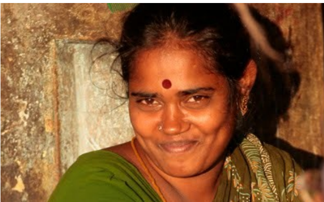
La marque rouge sur le front, le tilak , symbolise le troisième œil de Shiva, celui qui éveille la conscience. Il peut indiquer une situation maritale pour une femme, ou l'appartenance à tel groupe religieux en fonction de sa forme pour un homme. Il est un signe de protection divine.

• Les dieux. Il existe une catégorie supérieure à celle des êtres humains : celle des dieux et des déesses. Les divinités, comme les animaux et les hommes, possèdent un atman et sont soumises au samsara. Toutefois, elles ne sont que partiellement dépendantes d'un corps, ce qui facilite leur détachement et améliore leur karma. Mais les divinités