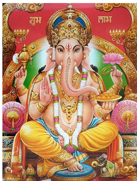
Ganesh, dieu hindou à tête d'éléphant, l'un des plus populaires aujourd'hui en Inde. Il porte bonheur, écarte les obstacles, dieu de la sagesse, de l'intelligence, de l'éducation et de la prudence.

Om (ou Aum) est un des plus importants symboles religieux de l'hindouisme. Il signifie l'Âme cosmique.