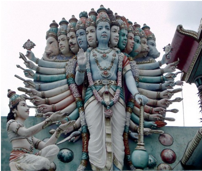
Avatars de Vishnu.

appellent la Shruti (« ce qui est entendu », « ce qui est révélé »). Les Vedas sont des recueils d'hymnes liturgiques que l'on récitait lors de sacrifices. Le plus célèbre est le Rig-Veda qui contient plus de mille poèmes à la gloire des dieux.