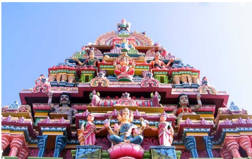
Les temples hindous de l'île Maurice sont des merveilles architecturales. On y découvre d'incroyables sculptures aux couleurs chatoyantes.

• Les Vedas (« la connaissance ») : ce sont les textes les plus anciens de l'hindouisme, rédigés, pour certains, dès le XVIII e siècle avant Jésus-Christ, ce qui en ferait pour une part d'entre eux les textes religieux les plus anciens du monde. Ils seraient issus d'une révélation divine – certains pensent du Brahman lui-même – et forment ce que les hindous