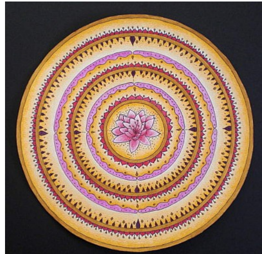
Exemple de mandala indien. Au centre, on distingue la fleur de lotus, symbole de la sagesse.

hindoues ne sont pas parfaites et peuvent aussi commettre de mauvaises actions : elles seront alors rétrogradées dans l'échelle des êtres et verront leur atman se réincarner en homme ou en animal. Un dieu qui a été rétrogradé ainsi dans la hiérarchie des êtres est appelé un avatar. D'après la tradition mythologique, le dieu Vishnu aurait eu ainsi neuf avatars (un poisson, une tortue, un sanglier, un homme lion, un homme nain, le prince Rama, le prince Parashurâma, le prince Krishna, Bouddha le fondateur même du bouddhisme) ; le dixième avatar étant à venir lors du jugement dernier et certains hindous affirmant même qu'il s'agirait de Jésus, d'autres de Mahomet.