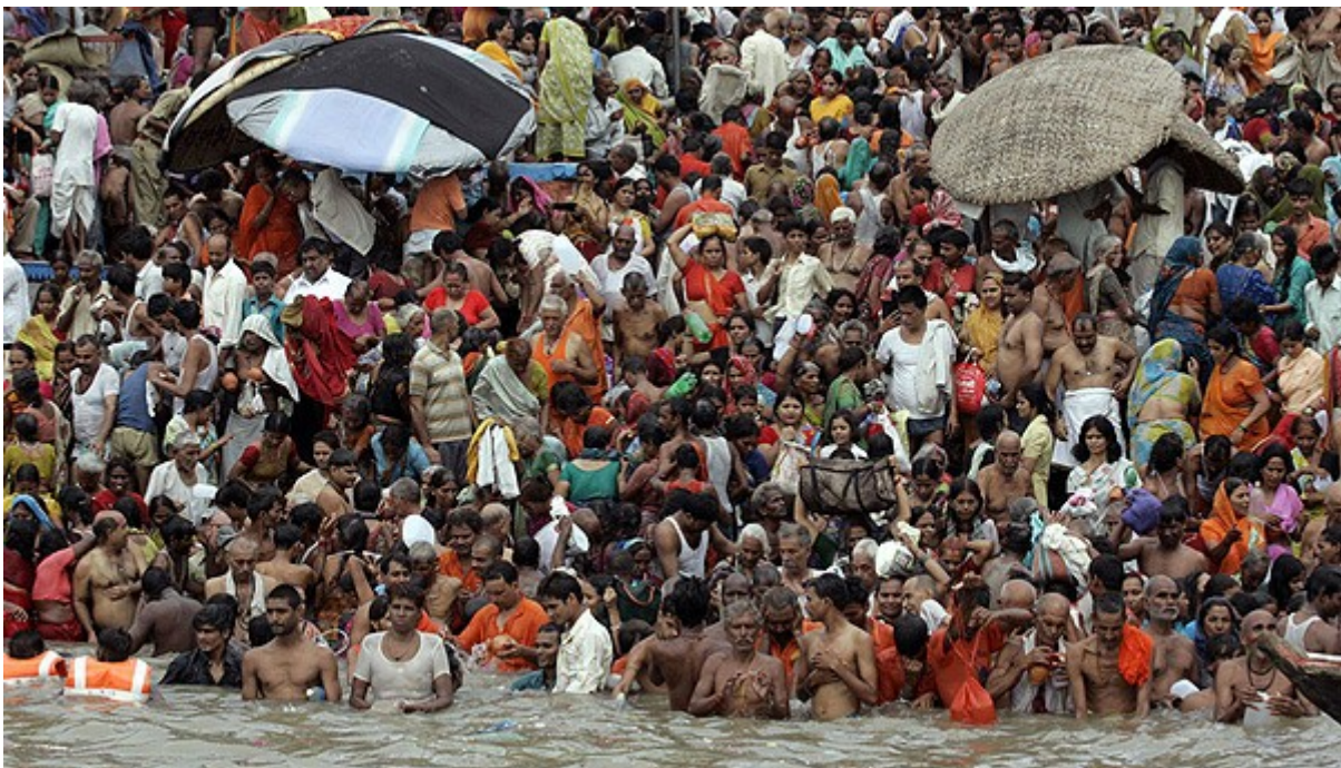
Les hindous sont des millions à se purifier dans le Gange, le fleuve sacré, sanctifié par les actions des dieux Brahma, Shiva et Vishnu. Disperser ses cendres dans le Gange permettrait d'avoir un meilleur karma, voire d'atteindre la moksha (cf. page 4)

Ainsi, quelqu'un dont l'atman s'incarne auprès d'une caste précise, est prédéterminé à connaître les conditions de vie propres à sa caste tout le temps de sa vie corporelle, sans pouvoir les changer avant sa mort. Son espoir sera alors d'améliorer son karma au cours de cette vie corporelle, par de bonnes actions, pour renaître dans une caste supérieure dans une prochaine vie. Il en découle notamment qu'un intouchable, quelle que soit la dureté de sa condition, ne se révoltera pas s'il est croyant, puisque ce n'est pas l'État ou la société qui, à ses yeux, sont responsables de sa triste situation, mais c'est lui-même. Il s'est façonné dans sa vie précédente : un mauvais karma suite à de mauvaises actions dont il est lui-même responsable. Ce qui pourrait être perçu de l'extérieur comme une injustice sociale est appréhendé, de l'intérieur, comme le respect de la Loi universelle (du Dharma).