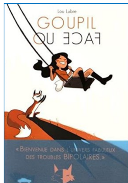
« Que faire quand on découvre un petit renard sauvage dans son cerveau ? »