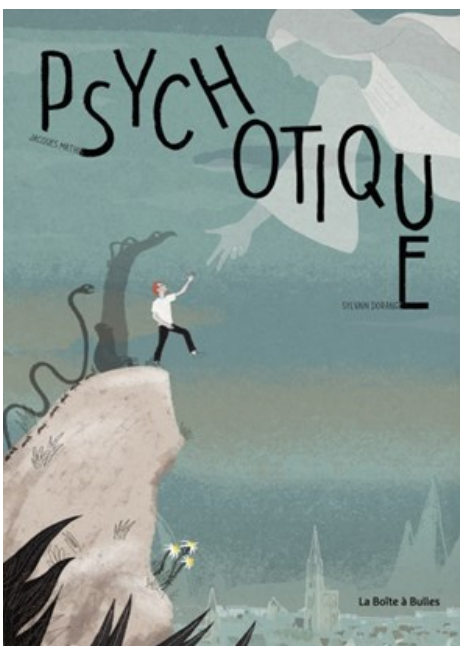
Psychotique est un album de 200 pages (24 euros)