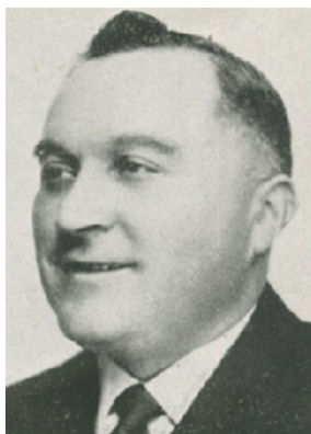
Victor Priou, député de la Mayenne (1951-1958)

Cette commune est celle de Peuton, dans le Sud-Mayenne. Beaucoup l'auront identifiée à la seule évocation de Victor Priou dont la réputation a dépassé les frontières de la Mayenne : outre de multiples engagements socioprofessionnels (syndicat agricole, groupement de défense sanitaire du bétail, Chambre d'agriculture, Mutualité sociale agricole, Crédit agricole...), l'ancien résistant, l'agriculteur de la Petite Mazure, fut maire de Peuton