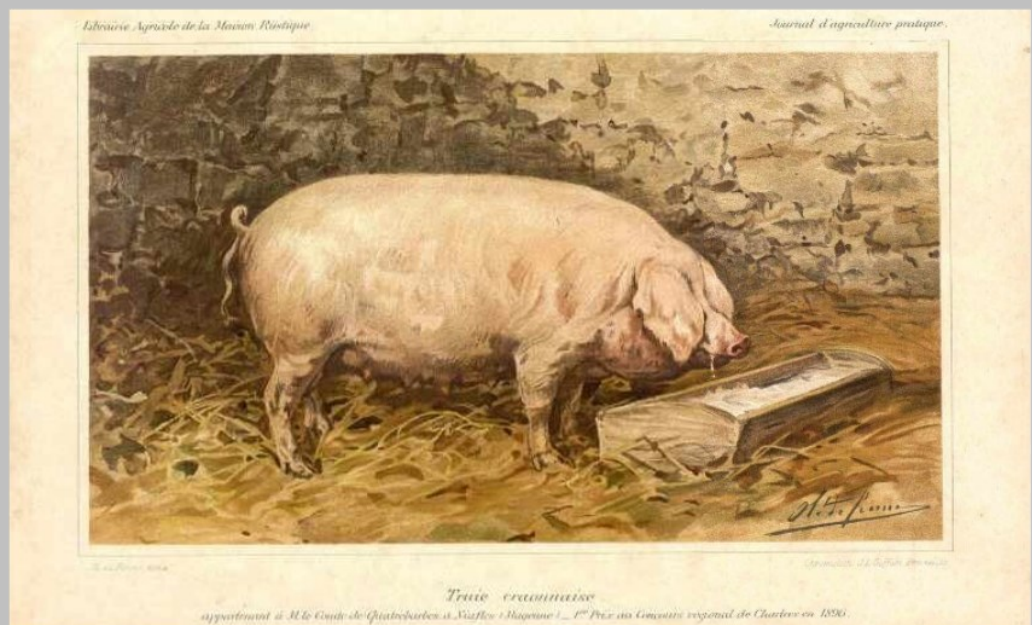
Les dessins, gravures, estampes et lithographies recèlent de petits trésors iconographiques, telle cette truie craonnaise appartenant au comte de Quatrebarbes, à Niaffes, qui lui a valu un premier prix au Concours régional de Chartres en 1896 (extrait du Journal d'agriculture pratique ).

Site Internet : https://archives.lamayenne.fr/ , rubrique « Chercher », puis « Archives iconographiques ». Dans ces archives iconographiques, on accède également à des photographies de cartes postales dites « anciennes », classées par commune ou par thème, ainsi qu'à un fonds de l'Œuvre diocésaine de projections lumineuses.