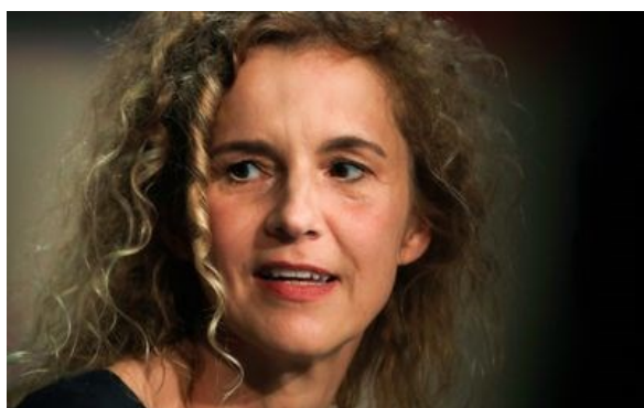
Delphine de Vigan : prix Renaudot et prix Goncourt des lycéens en 2015 avec son roman D'après une histoire vraie .

nages, comme cette directrice odieuse, autoritaire, infantilissante, maltraitante.