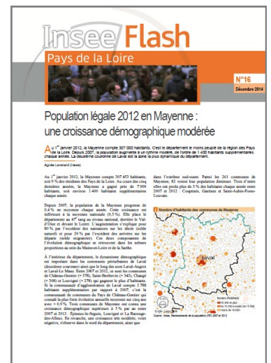
Variation annuelle de population en Mayenne (2007 à 2012 – au 1 er janvier)

Nous observons un fléchissement de la population : ce n'est pas rassurant pour ceux qui voient dans une forte croissance démographique une garantie de bonne santé, notamment économique.