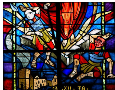
Le vitrail inattendu de l'église d'Izé

Jeudi 20 juillet : Izé. L'église est connue pour ses étonnants vitraux où figurent François Mitterrand et Georges Marchais.