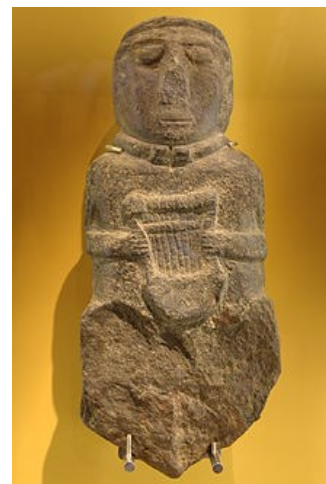
Statue de buste à la lyre ("barde") datant de La Tène, découverte lors de fouilles de la forteresse de Paule.

Animation gratuite. Rappel : visite guidée de l'exposition temporaire tous les dimanches à 11 h. Durée : une heure. Tarif : entrée du musée. Cf. La Lettre du CÉAS n° 326 de mai 2016 (pages 4 et 5).