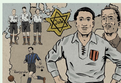
Dessin de Robin Walter sur Julius Hirsch, star du football allemand, assassiné par les nazis, extrait de Transversale