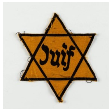
L'étoile jaune est un dispositif de discrimination et de marquage imposé par l'Allemagne nazie aux Juifs résidant dans les zones conquises au cours de la Seconde Guerre mondiale

Mémorial des Déportés de la Mayenne , 23 rue Ambroise-de-Loré, à Mayenne. Tél. 02 43 08 87 35. Mél. memorial.deportes53@gmail.com Ouvert à la visite du mardi au samedi et le premier dimanche du mois, de 14 h à 18 h. Tarif d'entrée : 5 euros (tarif réduit : 3 euros).