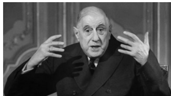
Le général De Gaulle est décédé le 9 novembre 1970 – il y a juste cinquante ans.

Tarif : 6 euros par conférence ou 15 euros pour le cycle complet.