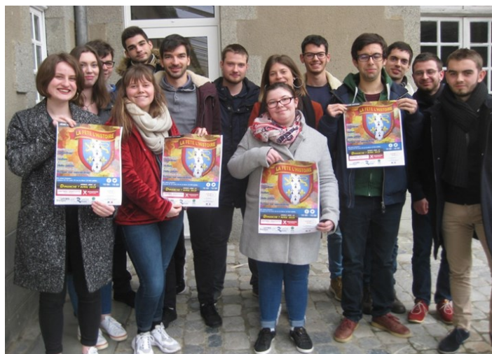
L'équipe organisatrice des historiens

Pour cette quatrième édition, la Fête de l'Histoire fait la part belle aux artistes qui ont embelli et mis en lumière le monde autour d'eux parce que, « À chaque art son Histo'art ». Du forum des associations historiques et de préservation du patrimoine