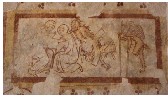
Quand le diable s'intéresse aux bavardes...

Tarif : 3 euros. Rendez-vous devant la chapelle Saint-Léonard, 371 impasse du Gué, à Mayenne.