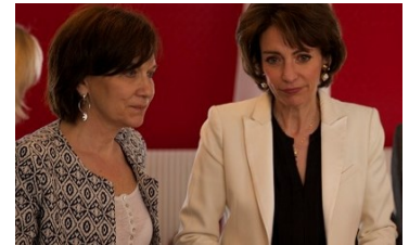
Laurence Rossignol et Marisol Touraine

Lors du Conseil des ministres du 3 juin 2014, la ministre Marisol Touraine et la secrétaire d'État Laurence Rossignol ont présenté le projet de loi relatif à l'adaptation de la société au vieillissement.