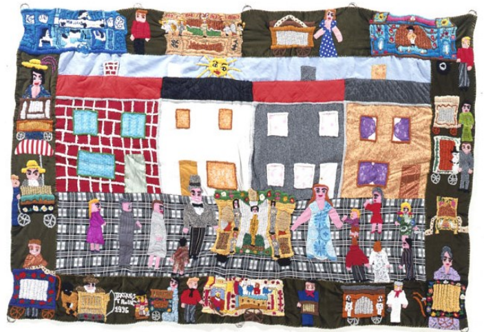
La chanteuse des rues avec les orgues de barbarie