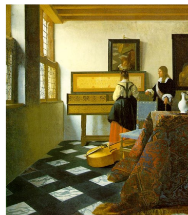
La leçon de musique, Vermeer, 1663

Son intérêt pour la musique se développe à cette époque. L'exemple par excellence de cette période est le tableau La leçon de musique . Dans cette œuvre, une jeune femme joue du virginal (sorte de petit clavecin), assistée de son maître. Sur l'instrument est gravée la devise : « La musique est la compagne de la joie, le remède à la douleur ». Au premier coup d'œil, cela n'est pas perceptible, mais Vermeer se représente dans ce tableau. Dans le miroir au dessus du virginal, on aperçoit les pieds du chevalet de l'artiste en train de peindre la toile. Par ailleurs, sur la table, au premier plan à droite, est disposée une cruche, symbole de virginité et de pureté (bien que certains y verront un appel à l'ivresse, à la décadence). Cette œuvre est le parangon du dernier style de Vermeer.