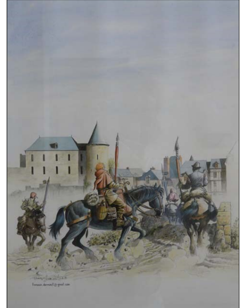
À travers un enregistrement audio, François Dermaut explique la conception de l'affiche de l'exposition. Les quatre chevaliers ont une particularité : l'avez-vous trouvée ?

On comprend mieux, à l'issue de cette visite guidée, les techniques de réalisation, mais, surtout, on ne verra plus avec le même regard les bandes dessinées d'un François Bourgeon ou d'un François Dermaut, tellement minutieux est leur travail sur le plan technique, tant ils sont scrupuleux et exigeants au niveau des recherches documentaires.