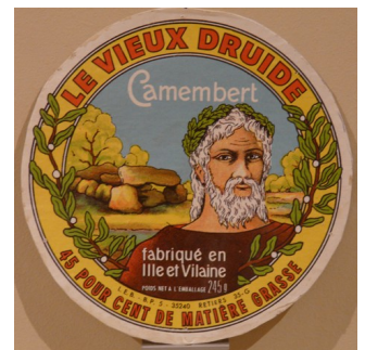
Le camembert attribue les dolmens aux Gaulois, comme si les hommes du Néolithique ne pouvaient eux-mêmes avoir des pratiques funéraires élaborées.

L'exposition manque peut-être d'interactivité. On aurait apprécié un peu plus d'humour... Mais à voir absolument pour comprendre l'Histoire, sa fabrication, ses dérives, et pour arrêter de colporter des bêtises sur l'homme préhistorique.