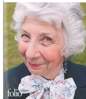
Les vieilles, de Pascale Gautier. Gallimard, 2010 (coll. « folio », 2012). Prix Renaudot poche 2012.