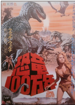
Affiche japonaise du film Un million d'années avant Jésus-Christ (1966), avec Raquel Welsh : quand l'homme préhistorique s'attaquait aux dinosaures !

Brute primitive, poilue, à demi-nue, avec des peaux de bête pour se couvrir ? On ne confondrait pas, par hasard, avec l'« homme des bois » créé par l'imagerie médiévale ?