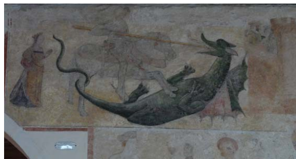
À Saint-Martin-de-Connée, saint Georges fait passer un mauvais quart d'heure à un méchant dragon.

Les animations estivales du Pays d'art et d'histoire Coëvrons-Mayenne vont se terminer fin septembre. Bien entendu, les trois sites majeurs – le château de Sainte-Suzanne, le musée départemental de Jublains et le château de Mayenne – vont rester actifs avec tout un programme d'expositions, conférences et ani-