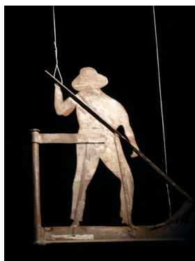
Girouette également prêtée pour l'exposition par le musée du Vieux-Château, à Laval.

Les Mayennais se réjouiront en particulier d'un partenariat entre l'écomusée et le musée du Vieux-Château de Laval. Celui-ci a prêté pour l'exposition des tuiles faitières de la Maison du Grand-Veneur, à Laval, et aussi diverses girouettes.