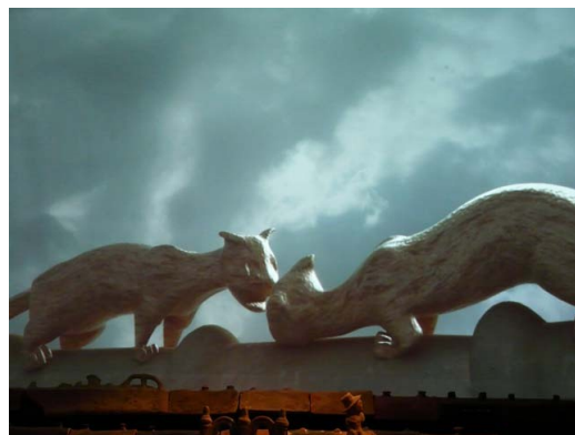
Extrait du film d'animation probablement le plus attractif pour sensibiliser aux ornements de toiture... et à la vie sur les toits.