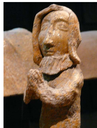
Orant, personnage en prière, qui provient de la Maison du Grand-Veneur, à Laval (tuile faitière en terre cuite, probablement du XVI e siècle). Ce personnage pouvait avoir pour fonction d'exercer une protection de la maisonnée.