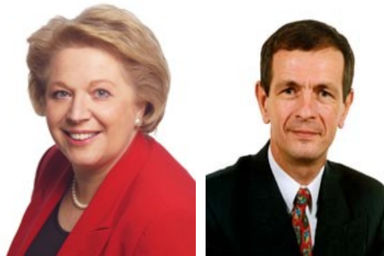
Marie-Jo Zimmermann et Jean-Louis Masson, deux élus de Moselle.

Dans une proposition de loi déposée fin 2010, d'une part à l'Assemblée nationale par Marie-Jo Zimmermann et, d'autre part, au Sénat par Jean-Louis Masson, les deux élus de Moselle attirent l'attention sur l'article L. 2121-21 du Code général des collectivités territoriales (CGCT). Cet article prévoit qu'au sein des conseils municipaux, le vote est à bulletins secrets si le tiers des membres présents le demande, mais qu'il est au scrutin public si le quart des membres présents le demande.